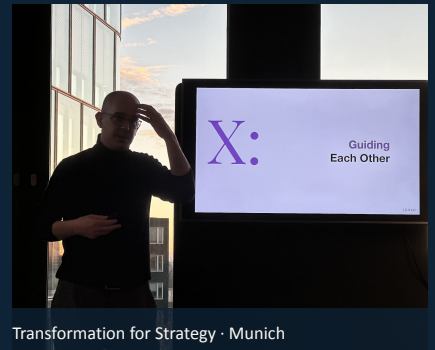
Transformation for Strategy · Munich