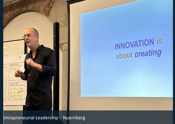
Intrapreneurial Leadership · Nuernberg