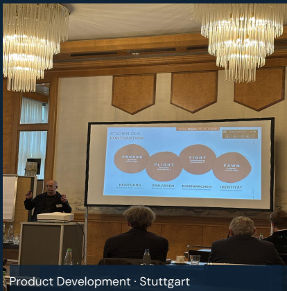
Product Development · Stuttgart