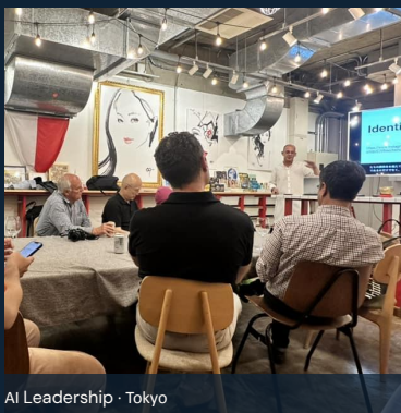
AI Leadership · Tokyo