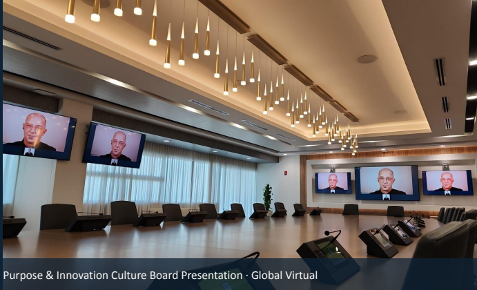
Purpose & Innovation Culture Board Presentation · Global Virtual