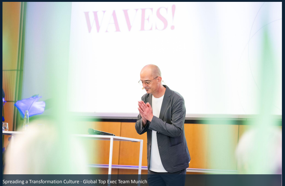
Spreading a Transformation Culture · Global Top Exec Team Munich