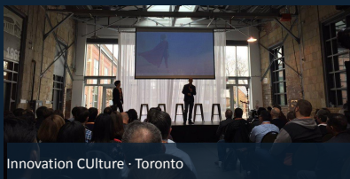
Innovation Culture · Toronto